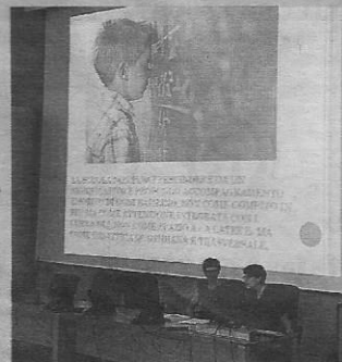
Pubblico e relatori della giornata di formazione